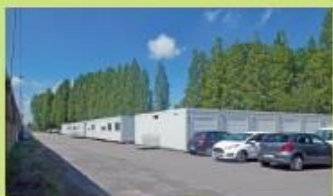
Préfabriqué - Site provisoire Gontran Rue Vancauwenberghe Z I de Petite-Synthe - Dunkerque 18 Arrêt "Triselec"