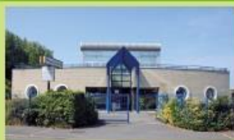
Poste Central de Trafic Rue de l'Abattoir - Dunkerque C5 Arrêt "Ecoparc"