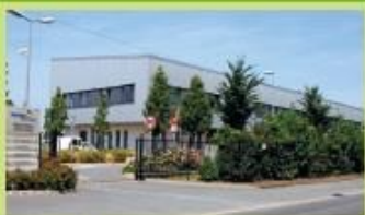
Centre Technique Communautaire (CTC) Rue Vancauwenberghe - Dunkerque 18 Arrêt "Triselec"