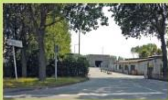
Régie collecte des déchets de Petite-Synthe Rue Alexis Carrel - Dunkerque 18 Arrêt "Triselec"