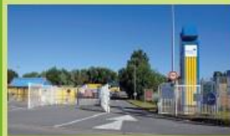
Déchèterie de Rosendaël Quai aux Fleurs - Dunkerque C5 C14 Arrêt "Paul Machy"