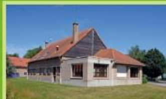
Atelier du lac Rue du Lac - Armbouts-Cappel 15 Arrêt "Le Lac"