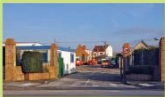
Régie voirie Avenue Desmidt - Dunkerque C5 C15 C19 Arrêt "Guynemer"