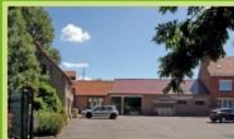
Atelier du Bois des Forts "Ferme Vansteenberghé" C.D n°2 - Coudekerque-Village 17 Arrêt "Rond point des Cyclos"