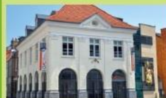
CIAC Chœur de Lumière 1 rue Pasteur - Bourbourg 23 Arrêt "Place Marché aux Chevaux"