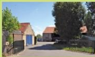
Pré-collecte "Ferme Degroote" 9 route de Cappelle Armbouts-Cappel 15 Arrêt "Coq Hardi"