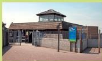
Parc Zoologique Rue des Droits de l'Homme Fort-Mardyck - www.parc-zoologique.fr 19 Arrêt "Zoo"