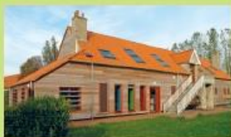
Ferme Wemaere Rue du Lac - Armbouts-Cappel 15 Arrêt "Le Lac"