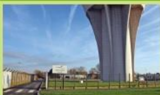
Atelier de la Villette Avenue de la Villette - Dunkerque C5 Arrêt "Ecoparc" C3 Arrêt "Pont Trystram"