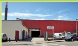
Atelier de St-Pol Rue Clemenceau - Saint-Pol-sur-Mer C2 Arrêt "Pont Ghesquière" C15 Arrêt "Mairie St-Pol"