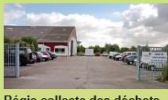
Régie collecte des déchets de Gravelines 3 rue Poincaré - Gravelines 22 23 Arrêt "Quai de la Batellerie" (à 18 minutes à pied)