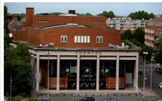
Construit en briques rouges et en béton, l'actuel bâtiment présente toutes les caractéristiques de l'architecture de la reconstruction.