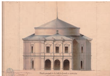
Vue de la façade principale du théâtre en 1836.