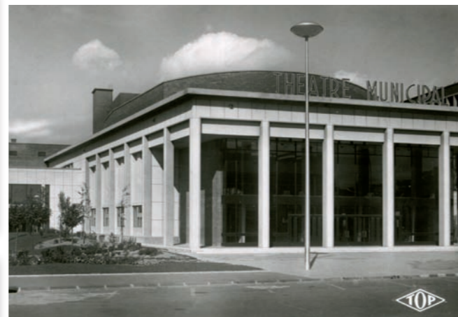
Le nouveau théâtre municipal, tel que les Dunkerquois purent le découvrir en 1963.

les travaux de construction s'achèvent deux ans plus tard, le 26 avril 1963. Oeuvre des architectes Jean Niernans et Jean Roussel, ce nouvel équipement se démarque des autres théâtres français par la sobriété et la pureté de ses lignes ainsi que par le classicisme et la modernité de son architecture. Dépourvu de décors ostentatoires, l'intérieur offre pour sa part un vaste hall d'accueil, une vingtaine de loges d'artistes, une petite salle de réception et une grande salle circulaire de 1 000 places. Très apprécié des Dunkerquois, cet établissement accueille alors tous types de manifestations : des représentations comiques, des concerts de musique classique, des opérettes, des spectacles de danse contemporaine, des conférences, voire des matchs de boxe. ■