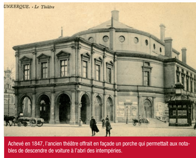
Achevé en 1847, l'ancien théâtre offrait en façade un porche qui permettait aux notables de descendre de voiture à l'abri des intempéries.