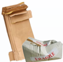
Papier et Carton