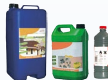
Solvants et colles