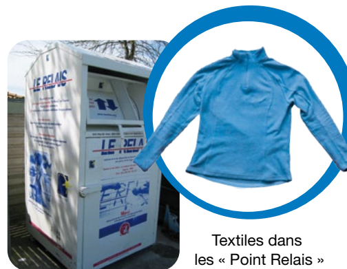
Textiles dans les « Point Relais »