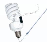
Ampoules économie d'énergie