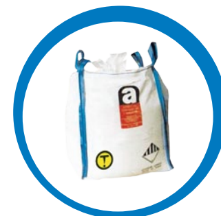
Déchets fibro-ciment (En déchèterie de Rosendaël uniquement, dans des sacs fermés fournis sur site)